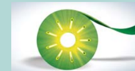
両面テープ Adhesive tape

外周封止・ジャンクションボックス固定用両面テープ・ガラス等国内外メーカーの太陽光モジュール構成部材・その他、お客様のアイデアあふれる加工や小ロット対応ご要望に合わせた部材を多数扱っています。